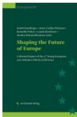
Shaping the Future of Europe Ladenpreis: 74,00EUR