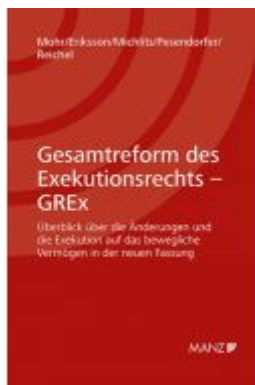
Gesamtreform des Exekutionsrechts - GREX Ladenpreis: 39,80 EUR