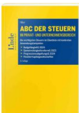
ABC der Steuern im Privat- und Unternehmensbereich Ladenpreis: 57,00EUR