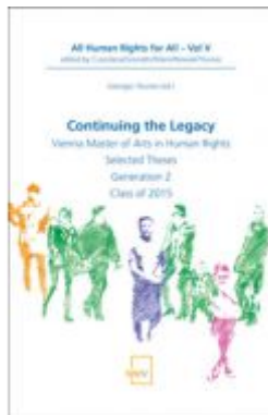
Continuing the Legacy Ladenpreis: 58,00 EUR