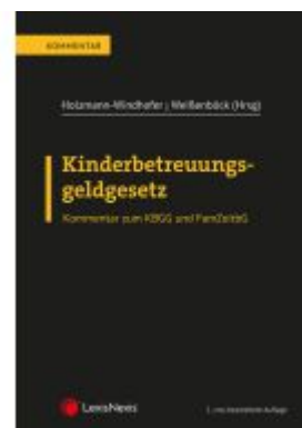
Kinderbetreuungsgeldgesetz Ladenpreis: 82,00EUR

Alle Preise inkl. MwSt. zzgl. Versand. Bei Bestellung im LexisNexis Onlineshop kostenloser Versand innerhalb Österreichs.