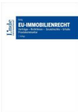
EU-Immobilienrecht Ladenpreis: 52,00EUR