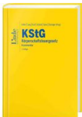
KStG | Körperschaftsteuergesetz Ladenpreis: 298,00EUR