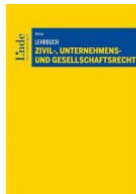
Lehrbuch Zivil-, Unternehmens- und Gesellschaftsrecht Ladenpreis: 44,00 EUR