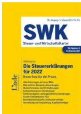
Die Steuererklärungen für 2022 Ladenpreis: 45,00EUR