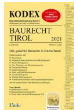
KODEX Baurecht Tirol 2021 Ladenpreis: 53,00 EUR