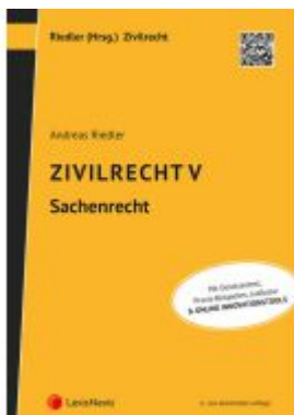
Zivilrecht V - Sachenrecht Ladenpreis: 50,00EUR

Wir haben andere Produkte gefunden, die Ihnen gefallen könnten!