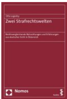
Zwei Strafrechtswelten Ladenpreis: 60,70 EUR