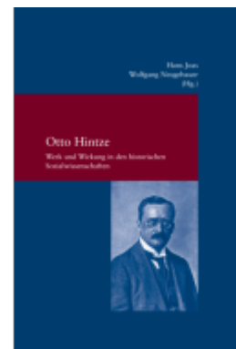
Otto Hintze Ladenpreis: 60,70EUR