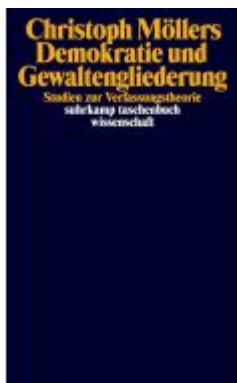
Demokratie und Gewaltengliederung Ladenpreis: 25,70EUR

Wir haben andere Produkte gefunden, die Ihnen gefallen könnten!