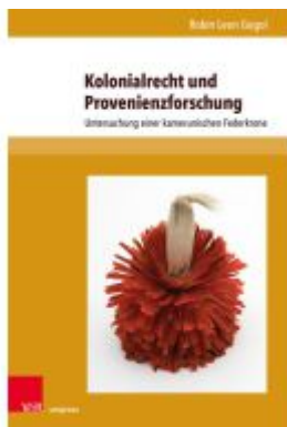
Kolonialrecht und Provenienzforschung Ladenpreis: 47,00EUR