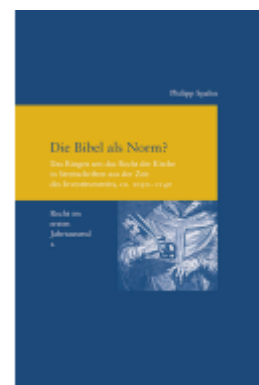
Die Bibel als Norm? Ladenpreis: 91,50EUR