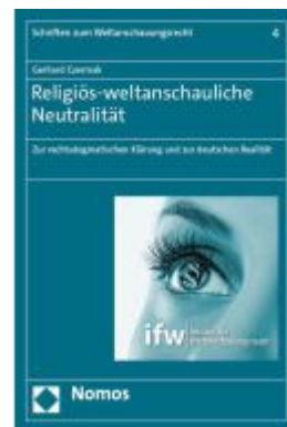
Religiös-weltanschauliche Neutralität Ladenpreis: 60,70EUR