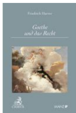
Goethe und das Recht Ladenpreis: 29,00EUR