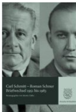
Briefwechsel 1951 bis 1983. Ladenpreis: 102,70EUR