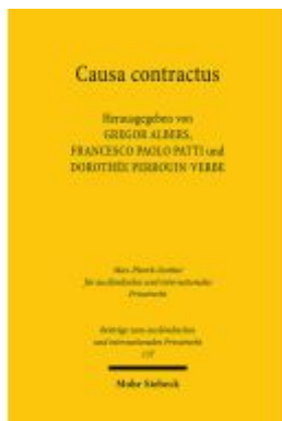
Causa contractus Ladenpreis: 142,90EUR