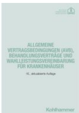
Allgemeine Vertragsbedingungen (AVB), Behandlungsverträge und Wahlleistungsvereinbarung für Krankenhäuser Ladenpreis: 37,10EUR