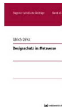
Designschutz im Metaverse Ladenpreis: 19,50EUR