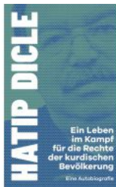
Ein Leben im Kampf für die Rechte der kurdischen Bevölkerung Ladenpreis: 20,60EUR