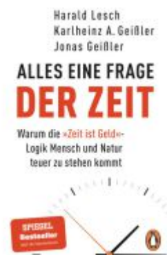
Alles eine Frage der Zeit Ladenpreis: 14,40EUR