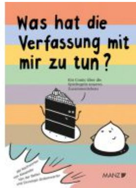
Was hat die Verfassung mit mir zu tun? Ladenpreis: 15,00EUR