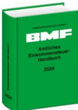
Amtliches Einkommensteuer-Handbuch 2024 Ladenpreis: 27,30EUR

Wir haben andere Produkte gefunden, die Ihnen gefallen könnten!