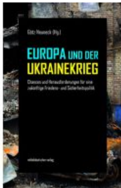
Europa und der Ukrainekrieg Ladenpreis: 20,60EUR