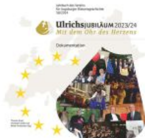
Jahrbuch des Verein für Augsburgener Bistumsgeschichte 58/2024 Ladenpreis: 29,90EUR