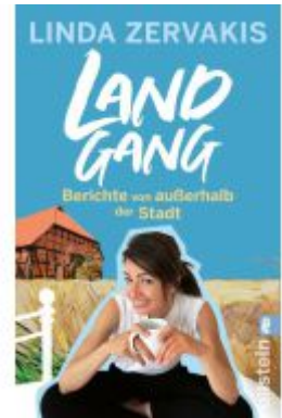
Landgang Ladenpreis: 13,40EUR