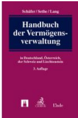
Handbuch der Vermögensverwaltung Ladenpreis: 249,00EUR