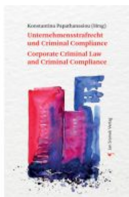
Unternehmensstrafrecht und Criminal Compliance Corporate Criminal Law and Criminal Compliance Ladenpreis: 198,00EUR