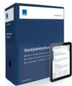
Konzipientenhandbuch Ladenpreis: 250,80EUR

Alle Preise inkl. MwSt. zzgl. Versand. Bei Bestellung im LexisNexis Onlineshop kostenloser Versand innerhalb Österreichs.