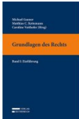
Grundlagen des Rechts Ladenpreis: 34,00EUR