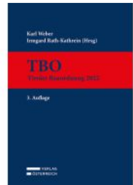
TBO Ladenpreis: 299,00EUR