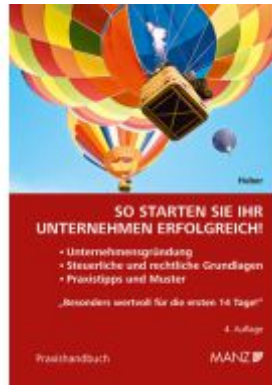
So starten Sie Ihr Unternehmen erfolgreich! Ladenpreis: 34,00EUR