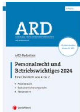
Personalrecht und Betriebswichtiges 2024 Ladenpreis: 89,00EUR