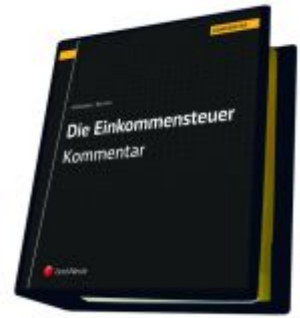
Die Einkommensteuer (EStG 1988) Band III - Kommentar Ladenpreis: 525,00EUR