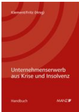
Unternehmenserwerb aus Krise und Insolvenz Ladenpreis: 78,00EUR

Wir haben andere Produkte gefunden, die Ihnen gefallen könnten!