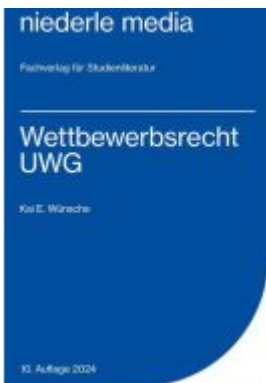
Wettbewerbsrecht - UWG - 2024 Ladenpreis: 15,40EUR