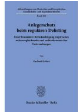
Anlegerschutz beim regulären Delisting Ladenpreis: 123,30EUR