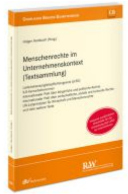
Menschenrechte im Unternehmenskontext (Textsammlung) Ladenpreis: 40,10EUR