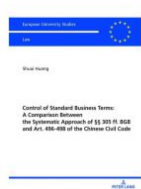
Control of Standard Business Terms: A Comparison between the Systematic Approach of §§ 305 ff. BGB and Art. 496-498 of the Chinese Civil Code Ladenpreis: 46,20EUR