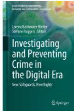
Investigating and Preventing Crime in the Digital Era Ladenpreis: 109,99EUR