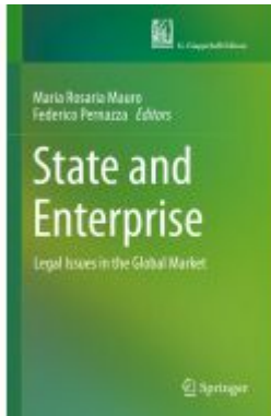
State and Enterprise Ladenpreis: 219,99EUR