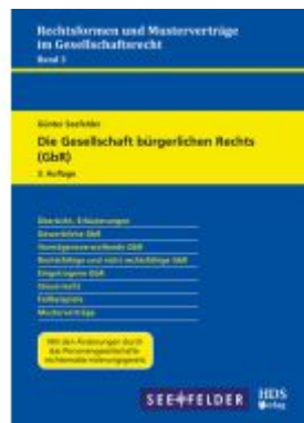
Die Gesellschaft bürgerlichen Rechts (GbR) Ladenpreis: 51,30EUR