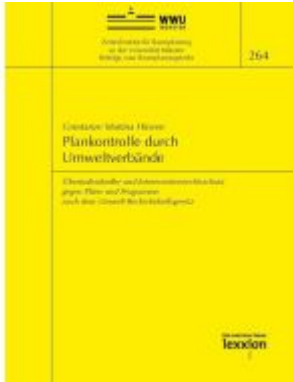
Plankontrolle durch Umweltverbände - Überindividueller und Interessentenrechtsschutz gegen Pläne und Programme nach dem Umwelt- Rechtsbehelfsgesetz Ladenpreis: 91,50EUR