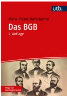
Das BGB Ladenpreis: 36,00EUR

Wir haben andere Produkte gefunden, die Ihnen gefallen könnten!