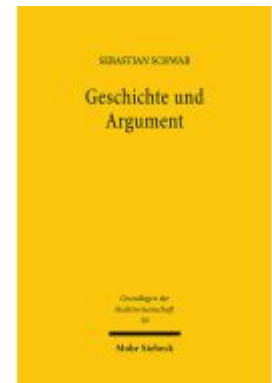
Geschichte und Argument Ladenpreis: 127,50EUR