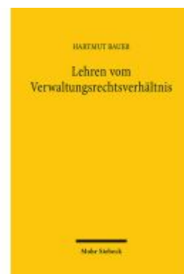
Lehren vom Verwaltungsrechtsverhältnis Ladenpreis: 81,30EUR