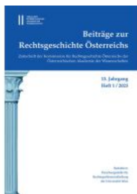
Beiträge zur Rechtsgeschichte Österreichs, 13. Jahrgang, Heft 1/2023 Ladenpreis: 49,00EUR