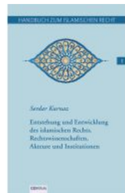
Handbuch zum islamischen Recht Bd. I. Ladenpreis: 23,50EUR