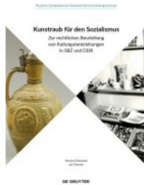
Kunstraub für den Sozialismus Ladenpreis: 39,00EUR