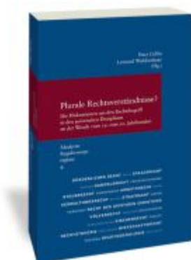
Plurale Rechtsverständnisse? Ladenpreis: 71,00EUR