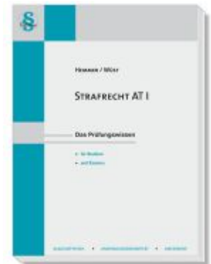
Strafrecht AT Ladenpreis: 22,50EUR