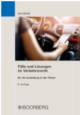
Fälle und Lösungen im Verkehrsrecht Ladenpreis: 29,70EUR