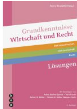
Grundkenntnisse Wirtschaft und Recht, Lösungen (Print inkl. digitales Lehrmittel) Ladenpreis: 43,20EUR