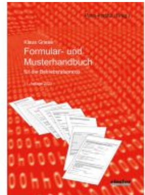
Formular- und Musterhandbuch für die Betriebsratspraxis Ladenpreis: 39,10EUR