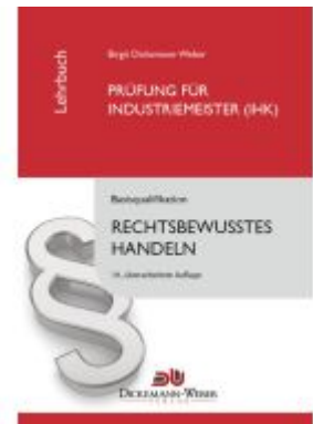
Industriemeister - Lehrbuch: Rechtsbewusstes Handeln Ladenpreis: 33,95EUR