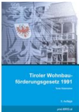
Tiroler Wohnbauförderungsgesetz 1991 Ladenpreis: 23,00EUR