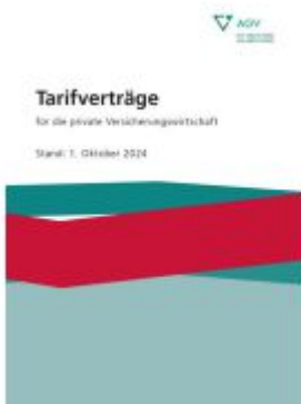
Tarifverträge für die private Versicherungswirtschaft Ladenpreis: 25,50EUR

Wir haben andere Produkte gefunden, die Ihnen gefallen könnten!