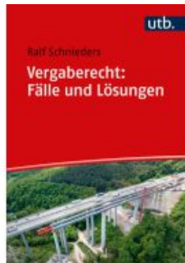
Vergaberecht: Fälle und Lösungen Ladenpreis: 25,60EUR