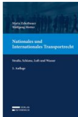
Nationales und Internationales Transportrecht Ladenpreis: 149,00EUR