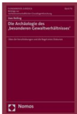
Die Archäologie des ‚besonderen Gewaltverhältnisses‘ Ladenpreis: 91,50EUR