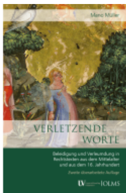
Verletzte Worte Ladenpreis: 59,70EUR