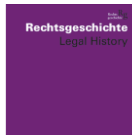
Rechtsgeschichte Legal History (RG). Zeitschrift des Max Planck-Instituts für Rechtsgeschichte und Rechtstheorie/Rechtsgeschichte Legal History Ladenpreis: 50,40EUR