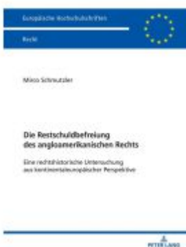
Die Restschuldbefreiung des angloamerikanischen Rechts Ladenpreis: 51,40EUR