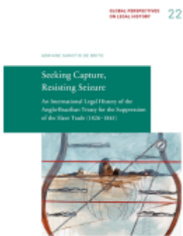
Seeking Capture, Resisting Seizure Ladenpreis: 19,50EUR