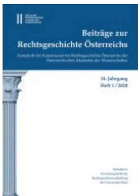
Beiträge zur Rechtsgeschichte Österreichs, 14. Jahrgang, Heft 1/2024 Ladenpreis: 69,00EUR