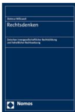
Rechtsdenken Ladenpreis: 132,70EUR