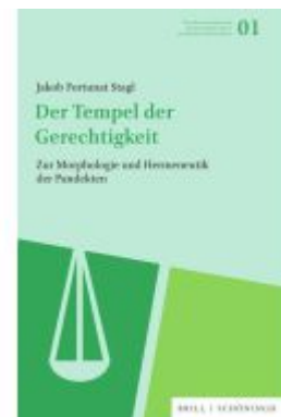
Der Tempel der Gerechtigkeit Ladenpreis: 117,20EUR