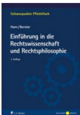
Einführung in die Rechtswissenschaft und Rechtsphilosophie Ladenpreis: 27,80EUR