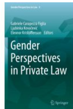
Gender Perspectives in Private Law Ladenpreis: 164,99EUR