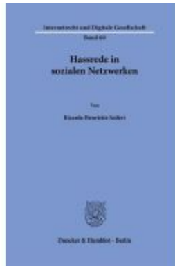
Hassrede in sozialen Netzwerken Ladenpreis: 102,70EUR