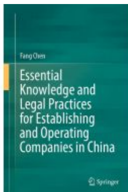
Essential Knowledge and Legal Practices for Establishing and Operating Companies in China Ladenpreis: 153,99EUR