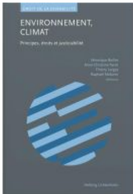
Environnement, climat Ladenpreis: 75,00EUR