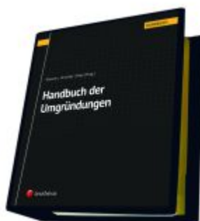
Handbuch der Umgründungen Ladenpreis: 475,00EUR