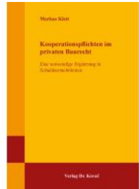
Kooperationspflichten im privaten Baurecht Ladenpreis: 101,60EUR