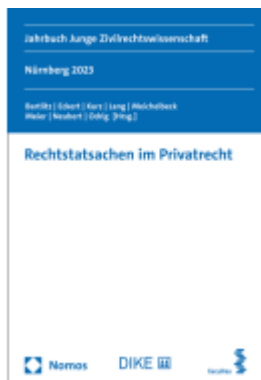
Rechtstatsachen im Privatrecht Ladenpreis: 84,00EUR