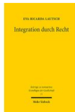
Integration durch Recht Ladenpreis: 96,70EUR