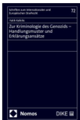
Zur Kriminologie des Genozids - Handlungsmuster und Erklärungsansätze Ladenpreis: 229,00EUR