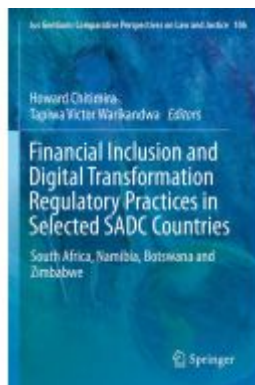
Financial Inclusion and Digital Transformation Regulatory Practices in Selected SADC Countries Ladenpreis: 175,99EUR