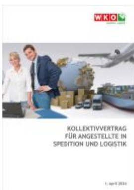
Kollektivvertrag für Angestellte in Spedition und Logistik Ladenpreis: 6,50EUR