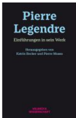
Pierre Legendre Ladenpreis: 39,90EUR

Wir haben andere Produkte gefunden, die Ihnen gefallen könnten!