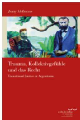
Trauma, Kollektivgefühle und das Recht Ladenpreis: 50,40EUR