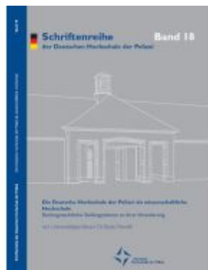
Die Deutsche Hochschule der Polizei als wissenschaftliche Hochschule Ladenpreis: 10,30EUR