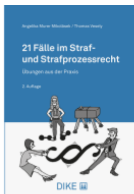
21 Fälle im Straf- und Strafprozessrecht Ladenpreis: 52,00EUR