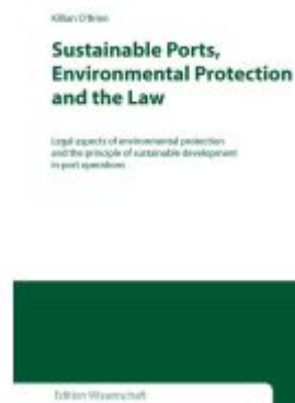
Sustainable Ports, Environmental Protection and the Law Ladenpreis: 41,10EUR