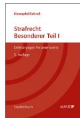
Strafrecht - Besonderer Teil I Ladenpreis: 61,00EUR