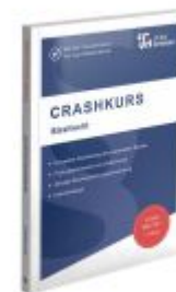
CRASHKURS Strafrecht Ladenpreis: 26,70EUR