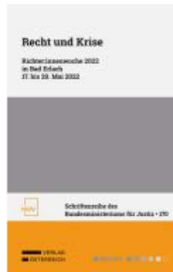
Recht und Krise Ladenpreis: 48,00EUR