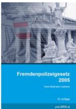
Fremdenpolizeigesetz 2005 Ladenpreis: 36,00EUR