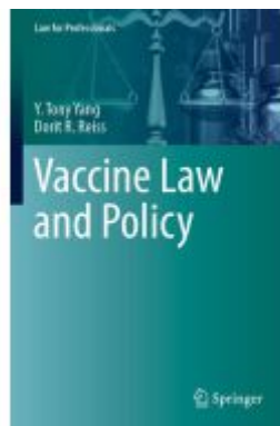
Vaccine Law and Policy Ladenpreis: 76,99EUR