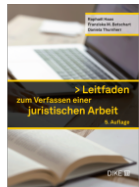
Leitfaden zum Verfassen einer juristischen Arbeit Ladenpreis: 50,00EUR