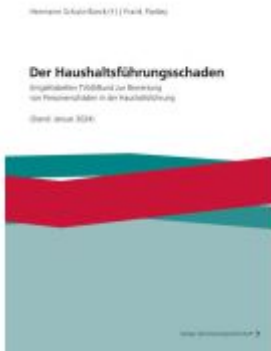
Der Haushaltsführungsschaden Ladenpreis: 35,80EUR