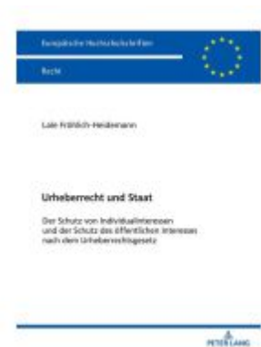
Urheberrecht und Staat Ladenpreis: 66,80EUR