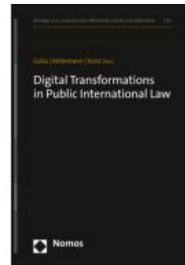
Digital Transformations in Public International Law Ladenpreis: 86,40EUR