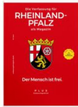
Die Verfassung für RHEINLAND-PFALZ als Magazin Ladenpreis: 12,00EUR