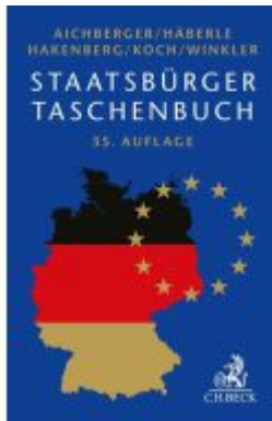
Staatsbürger-Taschenbuch Ladenpreis: 35,90EUR