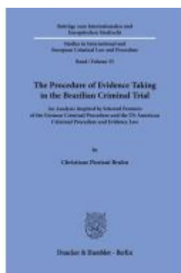
The Procedure of Evidence Taking in the Brazilian Criminal Trial. Ladenpreis: 92,50EUR