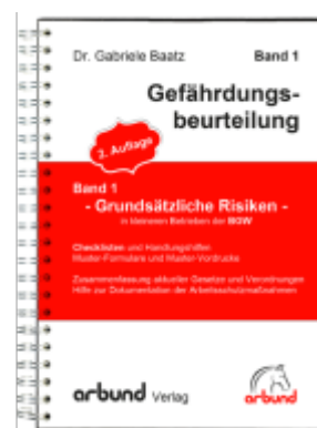
Band 1 - Gefährdungsbeurteilung "Grundsätzliche Risiken" Ladenpreis: 153,20EUR