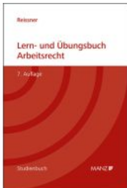
Lern- und Übungsbuch Arbeitsrecht Ladenpreis: 66,00EUR