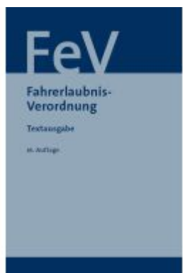
Fahrerlaubnisverordnung Ladenpreis: 17,40EUR