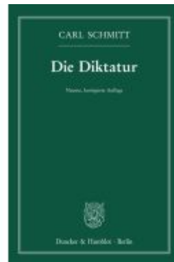
Die Diktatur. Ladenpreis: 46,20EUR