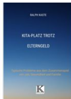
KITA-Platz trotz Elterngeld Ladenpreis: 25,70EUR