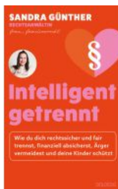
intelligent getrennt - Der Trennungs- und Scheidungsratgeber für Frauen - Scheidung - Trennung - Unterhalt - Obsorge Ladenpreis: 22,00EUR