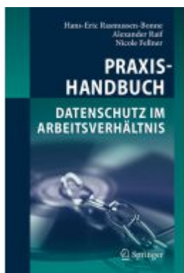
Praxishandbuch Datenschutz im Arbeitsverhältnis Ladenpreis: 51,35EUR