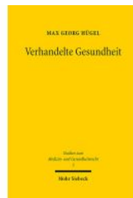
Verhandelte Gesundheit Ladenpreis: 86,40EUR