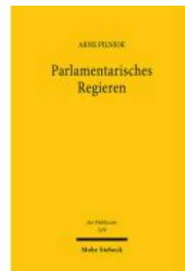
Parlamentarisches Regieren Ladenpreis: 142,90EUR