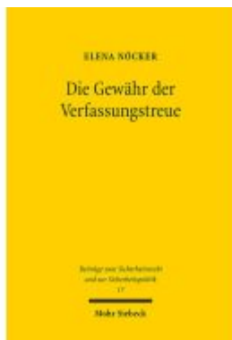
Die Gewähr der Verfassungstreue Ladenpreis: 107,00EUR