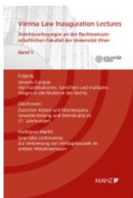
Vienna Law Inauguration Lectures Antrittsvorlesungen an d. rechtswissenschaftlichen Fakultät der Universität Wien Ladenpreis: 29,60EUR