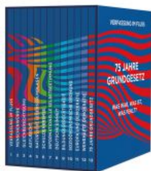
Verfassung im Fluss Ladenpreis: 18,50EUR