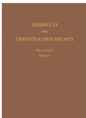
Jahrbuch des öffentlichen Rechts der Gegenwart. Neue Folge Ladenpreis: 256,00EUR