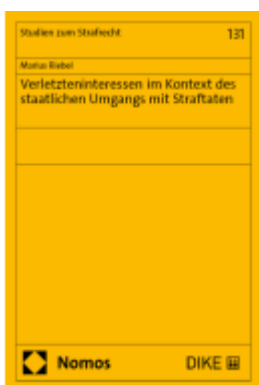
Verletzteninteressen im Kontext des staatlichen Umgangs mit Straftaten Ladenpreis: 159,00EUR