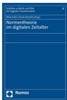
Normentheorie im digitalen Zeitalter Ladenpreis: 55,60EUR