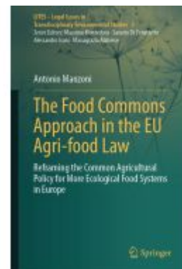
The Food Commons Approach in the EU Agri-food Law Ladenpreis: 153,99EUR