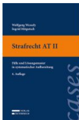
Strafrecht AT II Ladenpreis: 28,00EUR