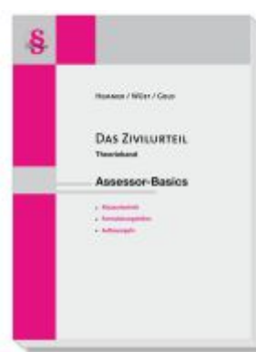
Das Zivilurteil Theorieband Ladenpreis: 22,50EUR