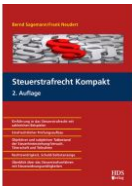
Steuerstrafrecht Kompakt Ladenpreis: 46,20EUR