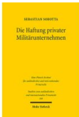
Die Haftung privater Militärunternehmen Ladenpreis: 81,30EUR