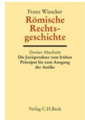
Römische Rechtsgeschichte Ladenpreis: 152,20EUR