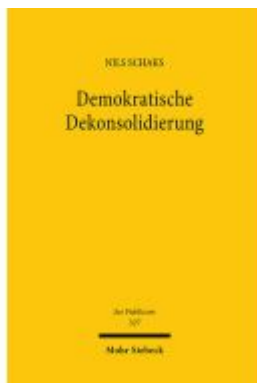
Demokratische Dekonsolidierung Ladenpreis: 117,20EUR