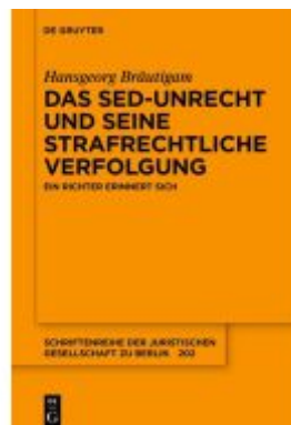
Das SED-Unrecht und seine strafrechtliche Verfolgung Ladenpreis: 29,95EUR