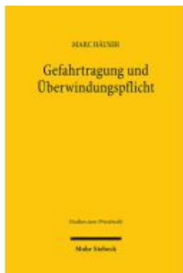
Gefahrtragung und Überwindungspflicht Ladenpreis: 112,10EUR