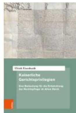
Kaiserliche Gerichtsprivilegien Ladenpreis: 72,00EUR