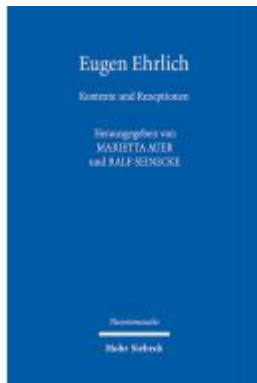
Eugen Ehrlich Ladenpreis: 50,40EUR