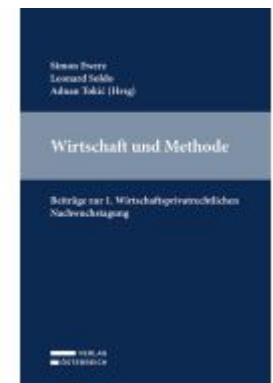
Wirtschaft und Methode Ladenpreis: 109,00EUR