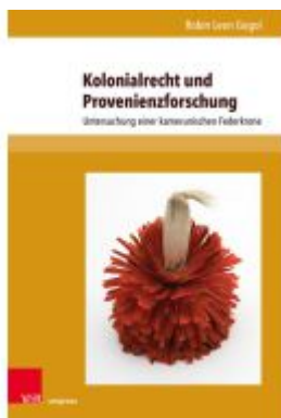
Kolonialrecht und Provenienzforschung Ladenpreis: 47,00EUR