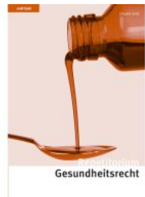
Repetitorium Gesundheitsrecht Ladenpreis: 76,00EUR