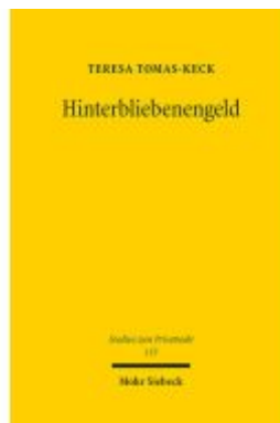
Hinterbliebenengeld Ladenpreis: 107,00EUR