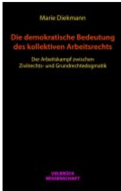
Die demokratische Bedeutung des kollektiven Arbeitsrechts Ladenpreis: 44,90EUR