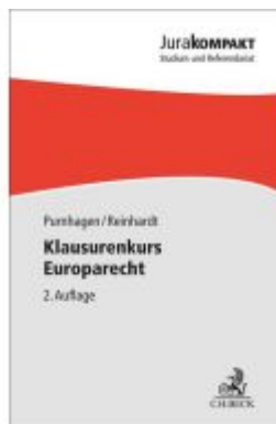
Klausurenkurs Europarecht Ladenpreis: 13,30EUR