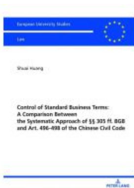
Control of Standard Business Terms: A Comparison between the Systematic Approach of §§ 305 ff. BGB and Art. 496-498 of the Chinese Civil Code Ladenpreis: 46,20EUR