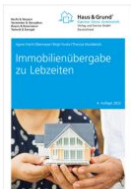
Immobilienübergabe zu Lebzeiten Ladenpreis: 13,40EUR