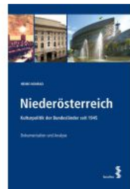
Niederösterreich Ladenpreis: 90,00EUR