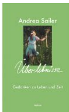
Überlebense – Gedanken zu Leben und Zeit Ladenpreis: 18,50 EUR