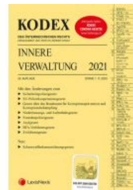
KODEX Innere Verwaltung 2021 Ladenpreis: 99,00 EUR