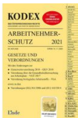
KODEX Arbeitnehmerschutz 2021 Ladenpreis: 37,00 EUR