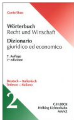
Wörterbuch Recht und Wirtschaft Deutsch - Italienisch Ladenpreis: 91,50 EUR