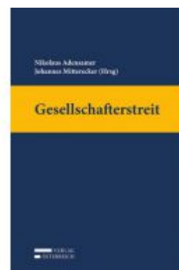
Gesellschafterstreit Ladenpreis: 189,00 EUR