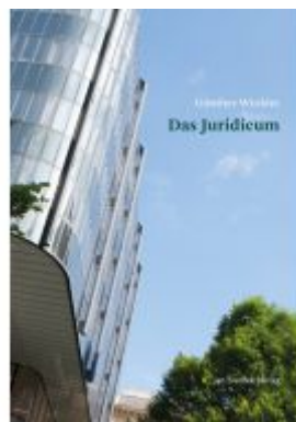
Das Juridicum Ladenpreis: 49,90 EUR