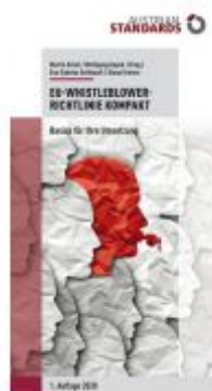
EU-Whistleblower-Richtlinie kompakt Ladenpreis: 29,70 EUR