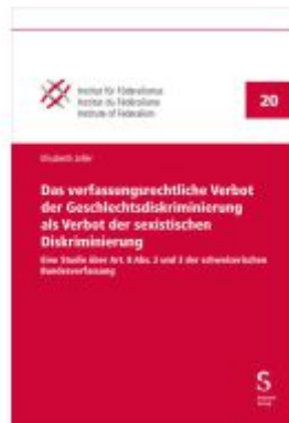
Das verfassungsrechtliche Verbot der Geschlechtsdiskriminierung als Verbot der sexistischen Diskriminierung Ladenpreis: 115,30EUR