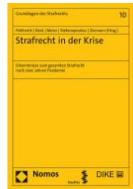
Strafrecht in der Krise Ladenpreis: 68,00EUR