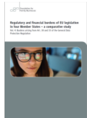
Regulatory and financial burdens of EU legislation in four Member States - a comparative study Ladenpreis: 41,10EUR