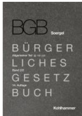
Kommentar zum Bürgerlichen Gesetzbuch mit Einführungsgesetz und Nebengesetzen (BGB) (Soergel) Ladenpreis: 545,00EUR