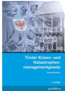
Tiroler Krisen- und Katastrophenmanagementgesetz Ladenpreis: 19,00EUR