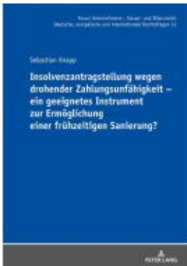
Insolvenzantragstellung wegen drohender Zahlungsunfähigkeit - ein geeignetes Instrument zur Ermöglichung einer frühzeitigen Sanierung? Ladenpreis: 111,10EUR