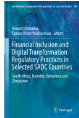
Financial Inclusion and Digital Transformation Regulatory Practices in Selected SADC Countries Ladenpreis: 175,99EUR