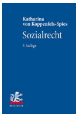
Sozialrecht Ladenpreis: 35,00EUR