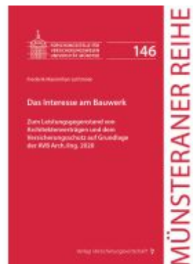
Das Interesse am Bauwerk Ladenpreis: 71,80EUR