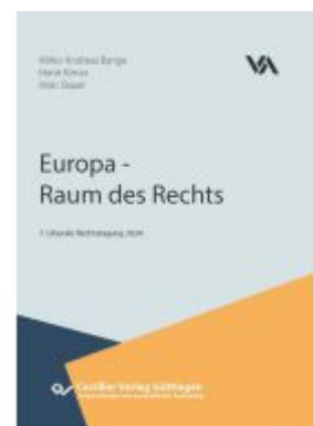
Europa - Raum des Rechts Ladenpreis: 104,70EUR