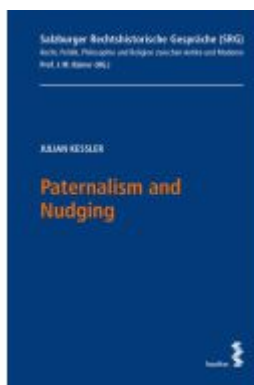
Paternalism and Nudging Ladenpreis: 22,00EUR