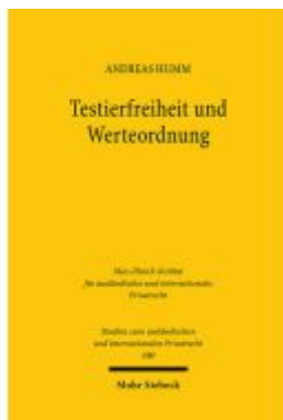
Testierfreiheit und Werteordnung Ladenpreis: 101,80EUR