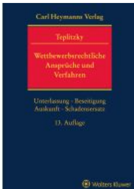
Wettbewerbsrechtliche Ansprüche und Verfahren Ladenpreis: 225,20EUR

Wir haben andere Produkte gefunden, die Ihnen gefallen könnten!