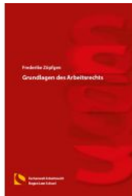
Grundlagen des Arbeitsrechts Ladenpreis: 25,70EUR