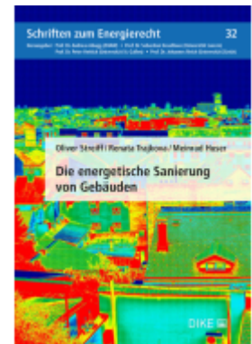
Die energetische Sanierung von Gebäuden Ladenpreis: 64,00EUR