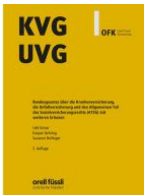
KVG/UVG Kommentar Ladenpreis: 203,60EUR