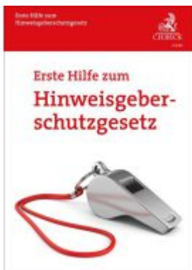
Erste Hilfe zum Hinweisgeberschutzgesetz Ladenpreis: 9,20EUR

Wir haben andere Produkte gefunden, die Ihnen gefallen könnten!