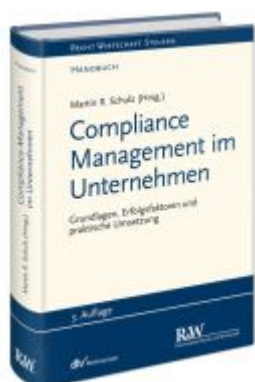
Compliance Management im Unternehmen Ladenpreis: 184,10EUR