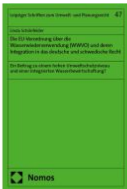
Die EU-Verordnung über die Wasserwiederverwendung (WWVO) und deren Integration in das deutsche und schwedische Recht Ladenpreis: 204,60EUR