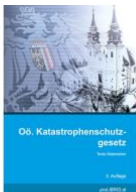
Oö. Katastrophenschutzgesetz Ladenpreis: 21,00EUR