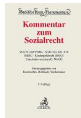
Kommentar zum Sozialrecht Ladenpreis: 266,30EUR