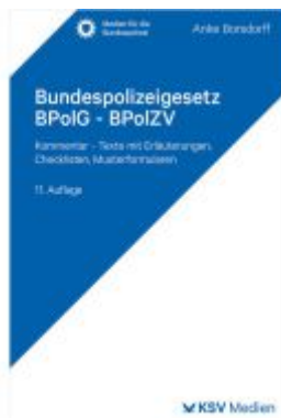
Bundespolizeigesetz BPolG - BPolZV Ladenpreis: 29,90EUR