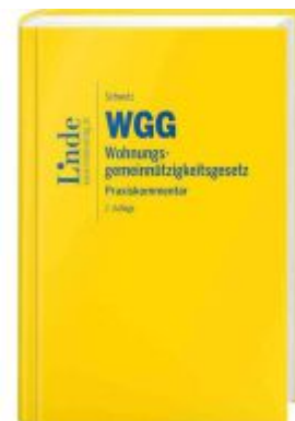
WGG I Wohnungsgemeinnützigkeitsgesetz Ladenpreis: 99,00EUR