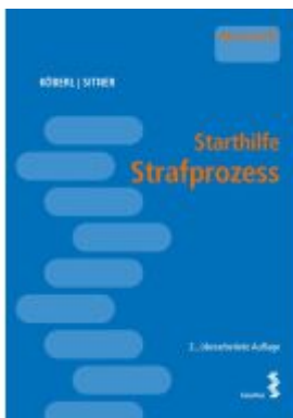
Starthilfe Strafprozess Ladenpreis: 26,00EUR