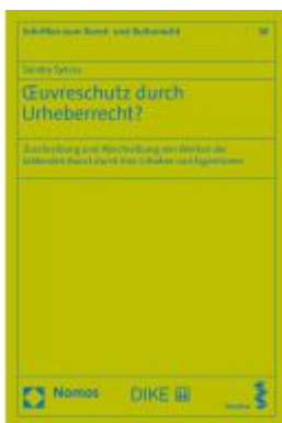
Euvreschutz durch Urheberrecht? Ladenpreis: 67,90EUR