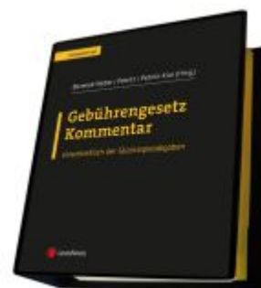
Gebührengesetz Kommentar Ladenpreis: 282,00EUR