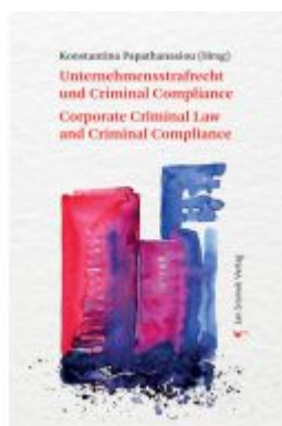
Unternehmensstrafrecht und Criminal Compliance Corporate Criminal Law and Criminal Compliance Ladenpreis: 198,00EUR