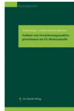
Verbote von Versicherungsmaklerprovisionen im EU- Binnenmarkt Ladenpreis: 49,90EUR