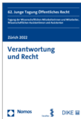
Verantwortung und Recht Ladenpreis: 49,00EUR