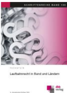
Laufbahnrecht in Bund und Ländern Ladenpreis: 60,60EUR

Wir haben andere Produkte gefunden, die Ihnen gefallen könnten!