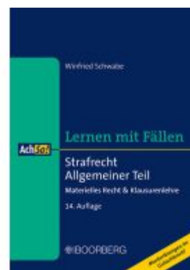
Strafrecht Allgemeiner Teil Ladenpreis: 22,10EUR