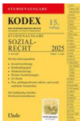
KODEX Studienausgabe Sozialrecht 2025 Ladenpreis: 15,00EUR