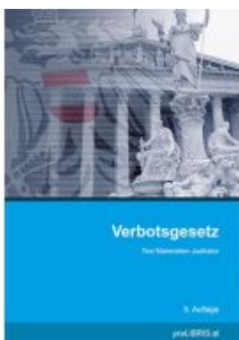
Verbotsgesetz Ladenpreis: 15,00EUR