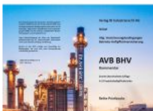
AVB BHV Kommentar Ladenpreis: 201,50EUR