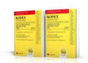
KODEX ZPO - IO für die WU 2025 - inkl. App Ladenpreis: 26,00EUR