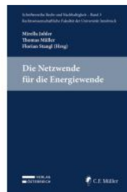
Die Netzwerke für die Energiewende Ladenpreis: 29,00EUR