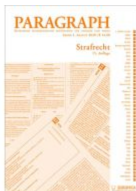
Paragraph - Strafrecht Ladenpreis: 14,90 EUR