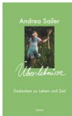
Überlebense – Gedanken zu Leben und Zeit Ladenpreis: 18,50 EUR