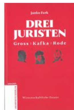
Drei Juristen - Gross - Kafka - Rode Ladenpreis: 12,90 EUR