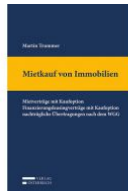
Mietkauf von Immobilien Ladenpreis: 109,00 EUR