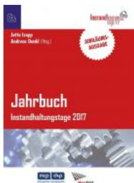
Jahrbuch Instandhaltungstage 2017 Ladenpreis: 54,90 EUR