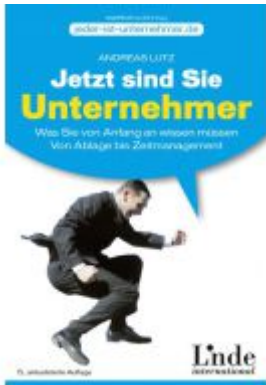
Jetzt sind Sie Unternehmer Ladenpreis: 19,90 EUR