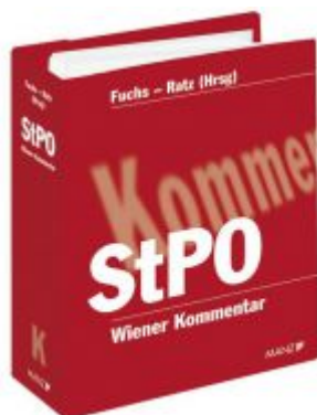
Wiener Kommentar zur StPO Ladenpreis: 398,00 EUR

Wir haben andere Produkte gefunden, die Ihnen gefallen könnten!