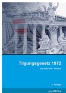
Tilgungsgesetz 1972 Ladenpreis: 13,00EUR