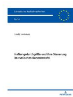
Haftungsdurchgriffe und ihre Steuerung im russischen Konzernrecht Ladenpreis: 63,70EUR