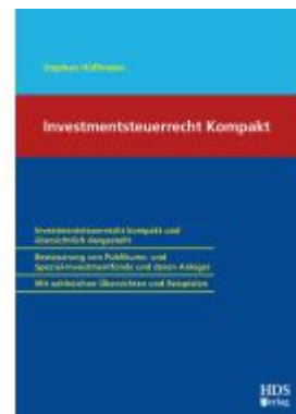
Investimentsteuerrecht Kompakt Ladenpreis: 102,70EUR