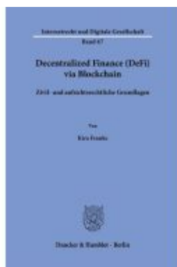
Decentralized Finance (DeFi) via Blockchain Ladenpreis: 113,00EUR