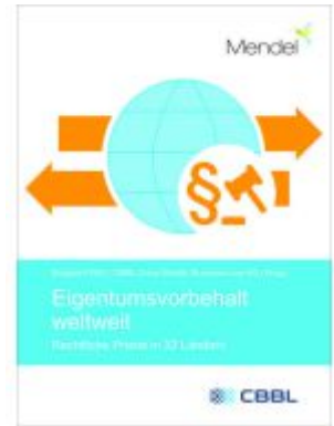
Eigentumsvorbehalt weltweit – Rechtliche Praxis in 32 Ländern Ladenpreis: 64,80EUR