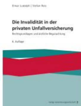
Die Invalidität in der privaten Unfallversicherung Ladenpreis: 56,40EUR