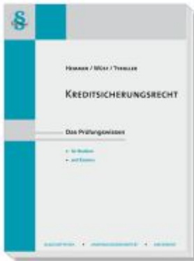
Kreditsicherungsrecht Ladenpreis: 22,50EUR