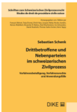
Drittbetroffene und Nebenparteien im schweizerischen Zivilprozess Ladenpreis: 104,00EUR