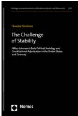
The Challenge of Stability Ladenpreis: 71,00EUR