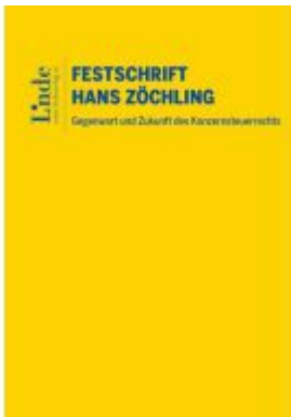
Gegenwart und Zukunft des Konzernsteuerrechts – Festschrift für Hans Zöchling Ladenpreis: 138,00EUR