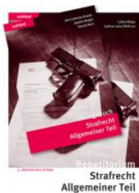
Strafrecht Allgemeiner Teil Kombipaket Ladenpreis: 72,00EUR