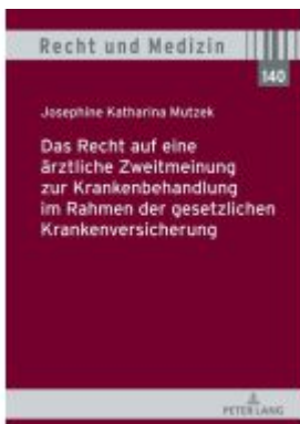
Das Recht auf eine ärztliche Zweitmeinung zur Krankenbehandlung im Rahmen der gesetzlichen Krankenversicherung Ladenpreis: 46,20EUR