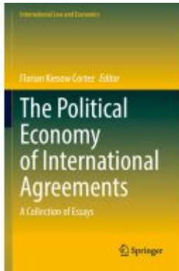
The Political Economy of International Agreements Ladenpreis: 175,99EUR