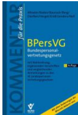
BPersVG – Bundespersonalvertretungsgesetz Ladenpreis: 203,60EUR