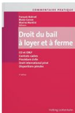
Commentaire pratique Droit du bail à loyer et à ferme Ladenpreis: 273,00EUR