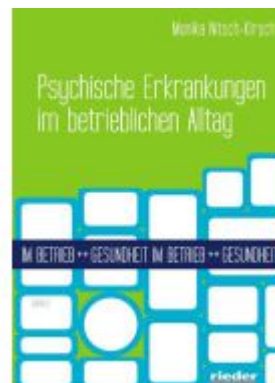
Psychische Erkrankungen im betrieblichen Alltag Ladenpreis: 24,70EUR