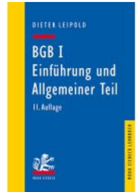
BGB I: Einführung und Allgemeiner Teil Ladenpreis: 28,80EUR