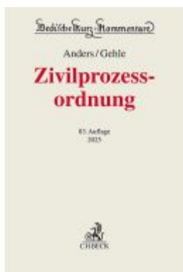
Zivilprozessordnung Ladenpreis: 194,30EUR