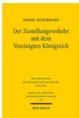
Der Zustellungsverkehr mit dem Vereinigten Königreich Ladenpreis: 91,50EUR