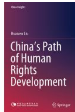
China's Path of Human Rights Development Ladenpreis: 109,99EUR