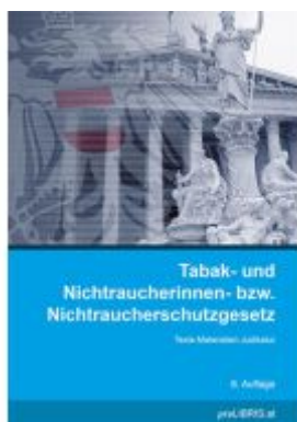
Tabak- und Nichtraucherinnen- bzw. Nichtraucherschutzgesetz Ladenpreis: 25,00EUR