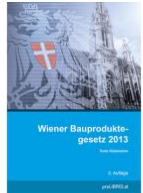
Wiener Bauproduktengesetz 2013 Ladenpreis: 17,00EUR