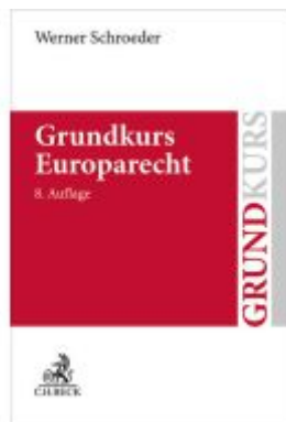
Grundkurs Europarecht Ladenpreis: 31,80EUR