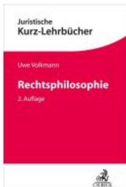
Rechtsphilosophie Ladenpreis: 24,60EUR