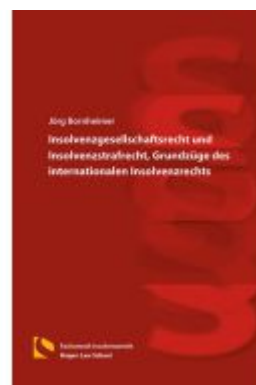
Insolvenzgesellschaftsrecht und Insolvenzstrafrecht, Grundzüge des internationalen Insolvenzrechts Ladenpreis: 36,00EUR