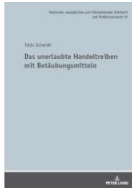
Das unerlaubte Handeltreiben mit Betäubungsmitteln Ladenpreis: 79,10EUR