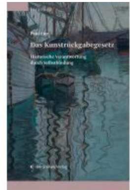
Das Kunstrückgabegesetz Ladenpreis: 78,00EUR