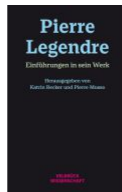
Pierre Legendre Ladenpreis: 39,90EUR