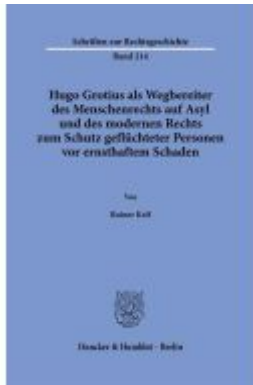
Hugo Grotius als Wegbereiter des Menschenrechts auf Asyl und des modernen Rechts zum Schutz geflüchteter Personen vor ernsthaftem Schaden.