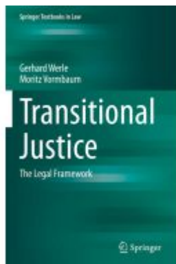
Transitional Justice Ladenpreis: 54,99EUR

Wir haben andere Produkte gefunden, die Ihnen gefallen könnten!