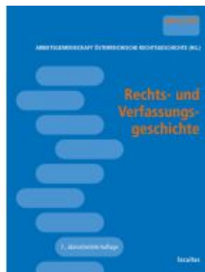
Rechts- und Verfassungsgeschichte Ladenpreis: 46,00EUR