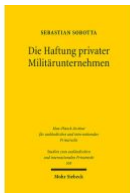
Die Haftung privater Militärunternehmen Ladenpreis: 81,30EUR