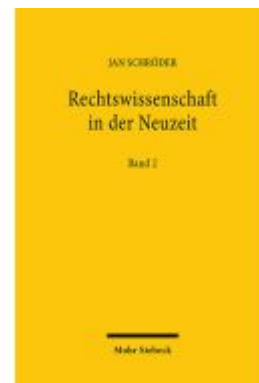
Rechtswissenschaft in der Neuzeit Ladenpreis: 137,80EUR