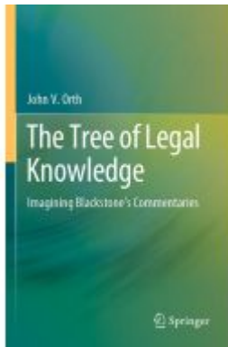
The Tree of Legal Knowledge