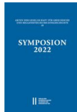
Symposium 2022 Ladenpreis: 120,00EUR