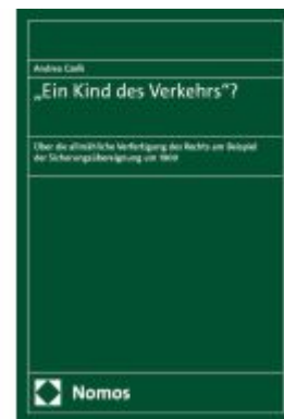
"Ein Kind des Verkehrs" Ladenpreis: 112,10EUR