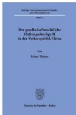
Der gesellschaftsrechtliche Haftungsdurchgriff in der Volksrepublik China Ladenpreis: 82,20EUR