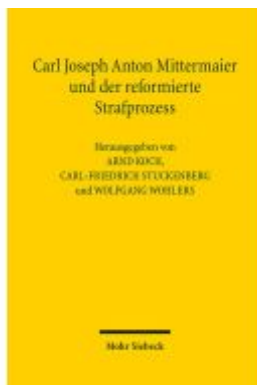
Carl Joseph Anton Mittermaier und der reformierte Strafprozess Ladenpreis: 107,00EUR