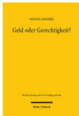
Geld oder Gerechtigkeit? Ladenpreis: 87,40EUR