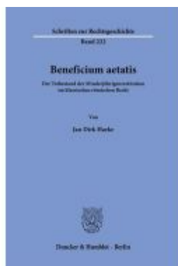
Beneficium aetatis. Ladenpreis: 71,90EUR