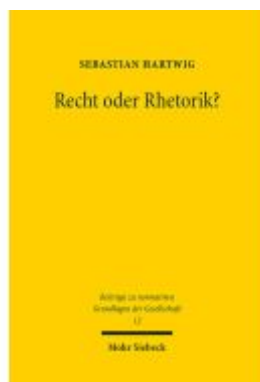
Recht oder Rhetorik? Ladenpreis: 127,50EUR