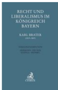
Recht und Liberalismus im Königreich Bayern Ladenpreis: 29,90EUR