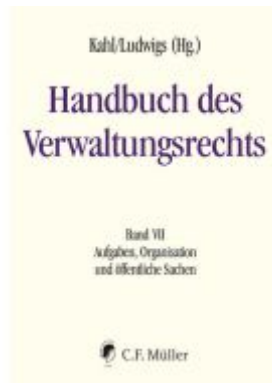
Handbuch des Verwaltungsrechts Ladenpreis: 287,90EUR