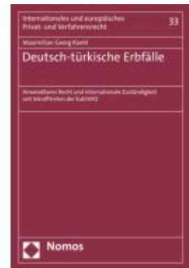
Deutsch-türkische Erbfälle Ladenpreis: 91,50EUR