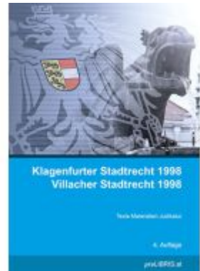
Klagenfurter Stadtrecht 1998 / Villacher Stadtrecht 1998 Ladenpreis: 27,00EUR