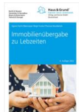
Immobilienübergabe zu Lebzeiten Ladenpreis: 13,40EUR