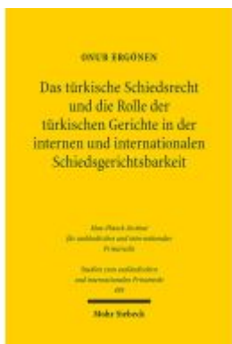
Das türkische Schiedsrecht und die Rolle der türkischen Gerichte in der internen und internationalen Schiedsgerichtsbarkeit Ladenpreis: 112,10EUR