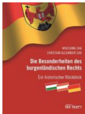
Die Besonderheiten des burgenländischen Rechts Ladenpreis: 22,00EUR