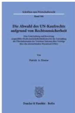
Die Abwahl des UN-Kaufrechts aufgrund von Rechtsunsicherheit. Ladenpreis: 102,70EUR