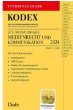
KODEX Studienausgabe Medienrecht und Kommunikation Ladenpreis: 15,00EUR