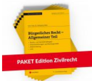
PAKET Edition Zivilrecht PLUS Ladenpreis: 143,00 EUR

Wir haben andere Produkte gefunden, die Ihnen gefallen könnten!