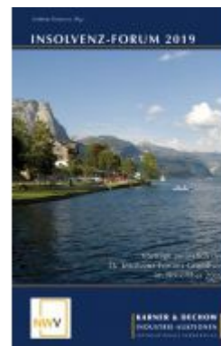
Insolvenz-Forum 2019 Ladenpreis: 54,80 EUR