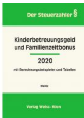
Kinderbetreuungsgeld und Familienzeitbonus 2020 Ladenpreis: 33,00 EUR