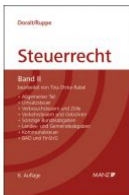
Grundriss des österreichischen Steuerrechts Ladenpreis: 68,00 EUR