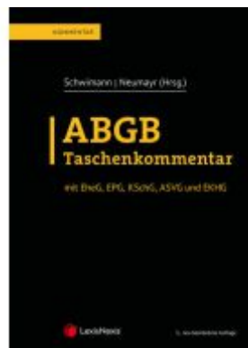
ABGB Taschenkommentar Ladenpreis: 319,00 EUR