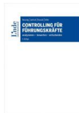
Controlling für Führungskräfte Ladenpreis: 68,00 EUR