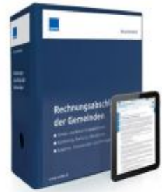
Rechnungsabschluss der Gemeinden Ladenpreis: 207,90 EUR