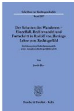
Der Schatten des Wanderers – Einzelfall, Rechtswandel und Fortschritt in Rudolf von Jherings Lehre vom Rechtsgefühl.