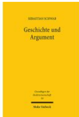
Geschichte und Argument