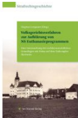
Volkgerechtsverfahren zur Aufklärung von NS Euthanasieprogrammen Ladenpreis: 59,90EUR