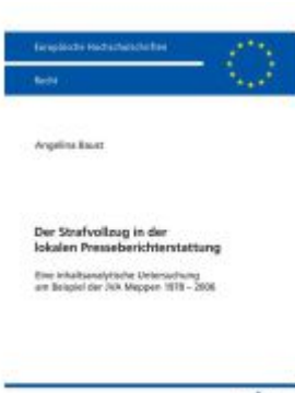
Der Strafvollzug in der lokalen Presseberichterstattung Ladenpreis: 56,50EUR