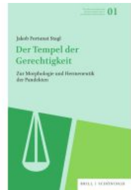
Der Tempel der Gerechtigkeit Ladenpreis: 117,20EUR