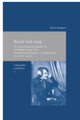
Recht hält jung Ladenpreis: 91,50EUR