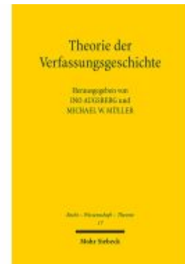
Theorie der Verfassungsgeschichte