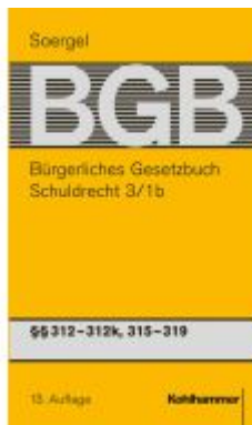
Bürgerliches Gesetzbuch mit Einführungsgesetz und Nebengesetzen (BGB) Ladenpreis: 247,00EUR