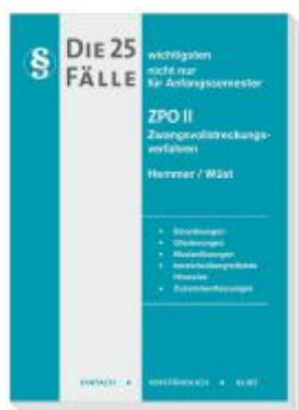
Die 25 wichtigsten Fälle Zivilprozessrecht (ZPO) II Ladenpreis: 16,40EUR