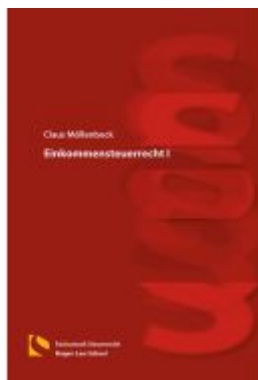
Einkommensteuerrecht I Ladenpreis: 25,70EUR