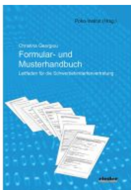
Muster- und Formularhandbuch Ladenpreis: 22,70EUR