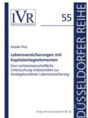
Lebensversicherungen mit Kapitalanlageelementen Ladenpreis: 56,40EUR