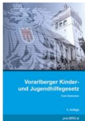
Vorarlberger Kinder- und Jugendhilfegesetz Ladenpreis: 23,00EUR