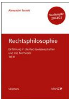
Rechtsphilosophie Einführung in die Rechtswissenschaften und ihre Methoden: Teil III Ladenpreis: 15,90EUR