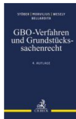
GBO-Verfahren und Grundstückssachenrecht Ladenpreis: 60,70EUR