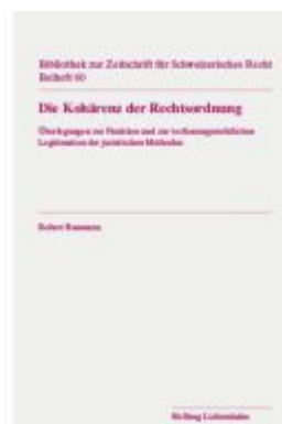
Die Kohärenz der Rechtsordnung Ladenpreis: 42,00EUR