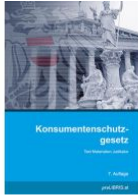
Konsumentenschutzgesetz Ladenpreis: 31,00EUR