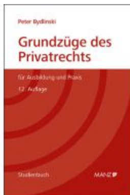
Grundzüge des Privatrechts Ladenpreis: 52,50EUR