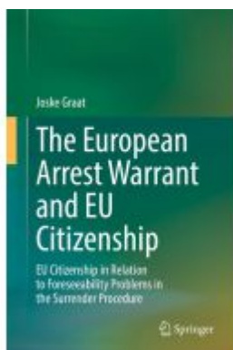
The European Arrest Warrant and EU Citizenship Ladenpreis: 164,99EUR