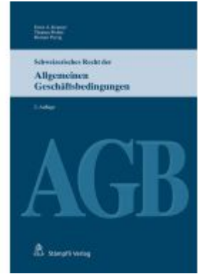
Schweizerisches Recht der Allgemeinen Geschäftsbedingungen (AGB) Ladenpreis: 186,90EUR