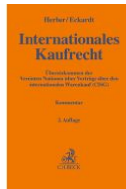
Internationales Kaufrecht Ladenpreis: 100,80EUR