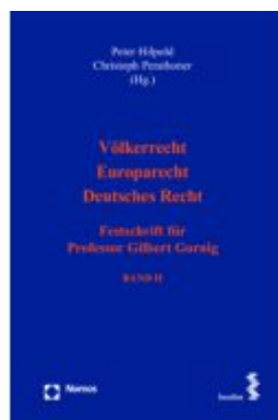
Völkerrecht – Europarecht – Deutsches Recht Ladenpreis: 166,60EUR