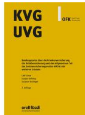
KVG/UVG Kommentar Ladenpreis: 203,60EUR