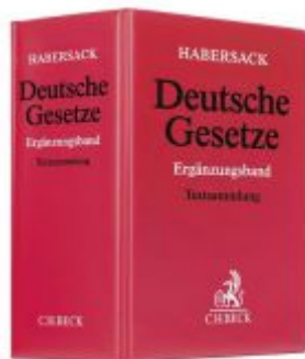
Deutsche Gesetze Ergänzungsband Ladenpreis: 29,90EUR