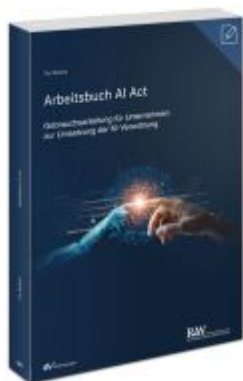
Arbeitsbuch AI Act Ladenpreis: 50,40EUR