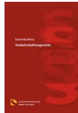
Verkehrshaftungsrecht Ladenpreis: 56,50EUR