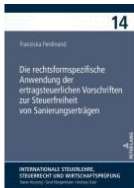
Die rechtsformspezifische Anwendung der ertragsteuerlichen Vorschriften zur Steuerfreiheit von Sanierungserträgen Ladenpreis: 102,80EUR