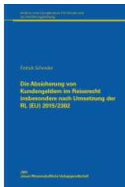
Die Absicherung von Kundengeldern im Reiserecht insbesondere nach Umsetzung der RL (EU) 2015/2302 Ladenpreis: 35,80EUR