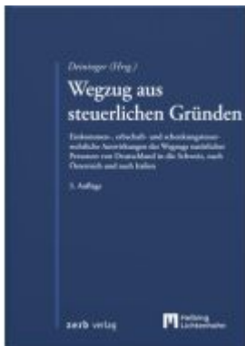
Wegzug aus steuerlichen Gründen Ladenpreis: 49,00EUR

Wir haben andere Produkte gefunden, die Ihnen gefallen könnten!