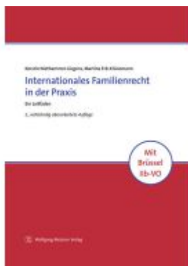
Internationales Familienrecht in der Praxis Ladenpreis: 56,40EUR