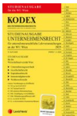
KODEX Unternehmensrecht für unternehmensrechtliche LVA (WU Wien) 2025 - inkl. App Ladenpreis: 21,00EUR