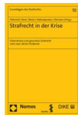
Strafrecht in der Krise Ladenpreis: 68,00EUR