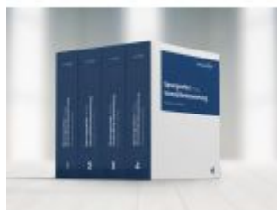
Immobilienbewertung - Marktdaten und Praxishilfen Ladenpreis: 199,00EUR