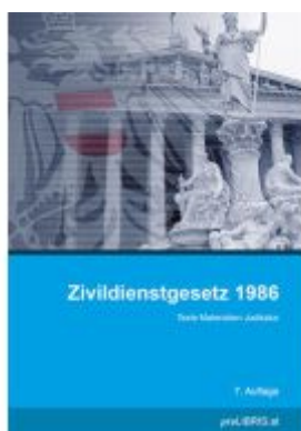
Zivildienstgesetz 1986 Ladenpreis: 31,00EUR