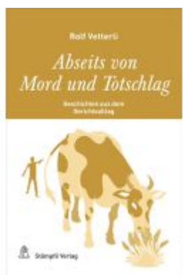
Abseits von Mord und Totschlag Ladenpreis: 41,30EUR