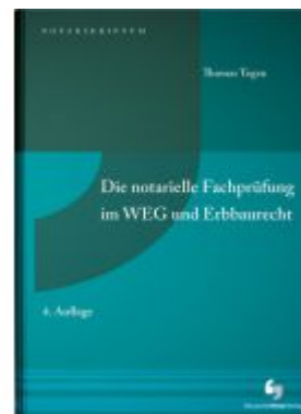
Die notarielle Fachprüfung im WEG und Erbsrecht Ladenpreis: 55,60EUR