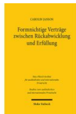
Formnichtige Verträge zwischen Rückabwicklung und Erfüllung Ladenpreis: 86,40EUR