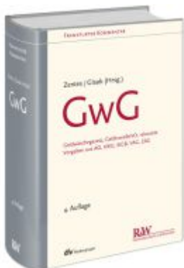
GWG Ladenpreis: 297,10EUR

Wir haben andere Produkte gefunden, die Ihnen gefallen könnten!