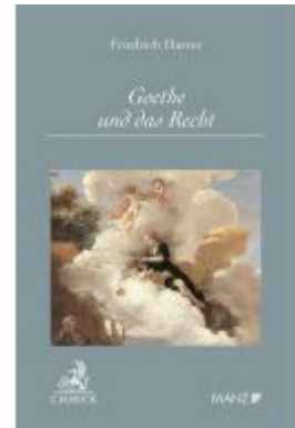
Goethe und das Recht Ladenpreis: 29,00EUR