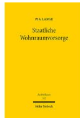
Staatliche Wohnraumvorsorge Ladenpreis: 127,50EUR