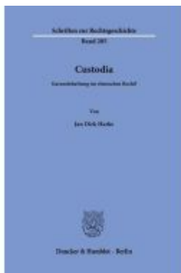
Custodia. Ladenpreis: 71,90EUR