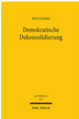
Demokratische Dekonsolidierung Ladenpreis: 117,20EUR