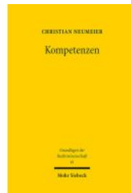
Kompetenzen Ladenpreis: 122,40EUR