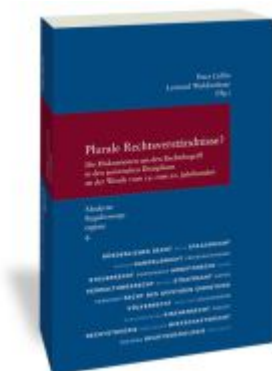
Plurale Rechtsverständnisse? Ladenpreis: 71,00EUR