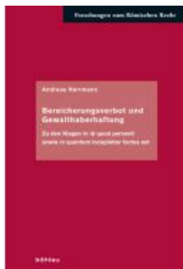
Bereicherungsverbot und Gewalthaberhaftung Ladenpreis: 67,00EUR