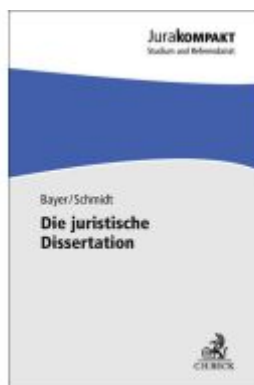
Die juristische Dissertation Ladenpreis: 13,30EUR