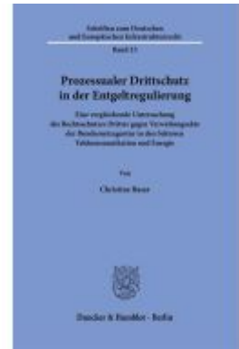
Prozessualer Drittschutz in der Entgeltregulierung. Ladenpreis: 123,30EUR