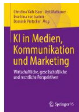
KI in Medien, Kommunikation und Marketing Ladenpreis: 92,51EUR