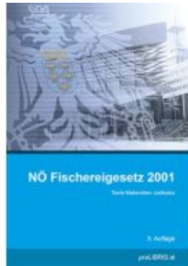
NÖ Fischereigesetz 2001 Ladenpreis: 24,00EUR