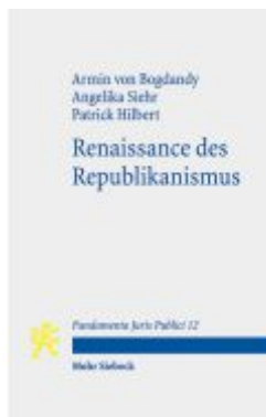
Renaissance des Republikanismus Ladenpreis: 24,70EUR