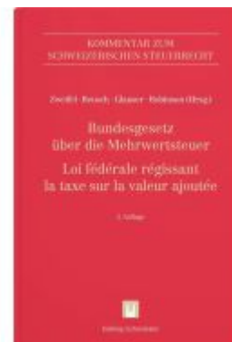
Bundesgesetz über die Mehrwertsteuer (MWSTG)/Loi fédérale régissant la taxe sur la valeur ajoutée (LTVA) Ladenpreis: 493,00EUR