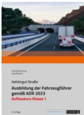
Ausbildung der Fahrzeugführer gemäß ADR 2023 - Aufbaukurs Klasse 1 Ladenpreis: 23,70EUR