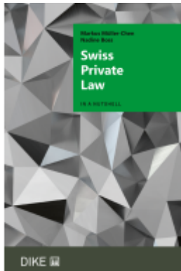
Swiss Private Law Ladenpreis: 52,00EUR