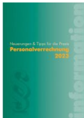
Personalverrechnung 2023 Ladenpreis: 44,00EUR