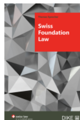
Swiss Foundation Law Ladenpreis: 58,00EUR