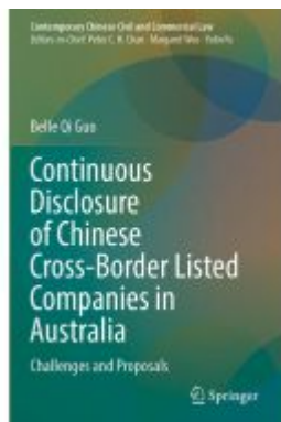
Continuous Disclosure of Chinese Cross- Border Listed Companies in Australia Ladenpreis: 175,99EUR