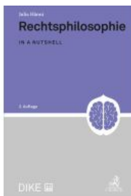
Rechtsphilosophie Ladenpreis: 65,89EUR