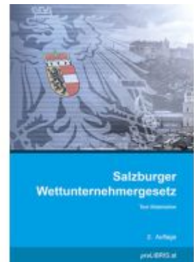
Salzburger Wettunternehmergesetz Ladenpreis: 26,00EUR