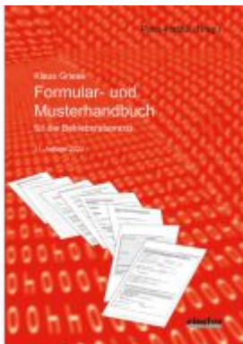
Formular- und Musterhandbuch für die Betriebsratspraxis Ladenpreis: 39,10EUR

Wir haben andere Produkte gefunden, die Ihnen gefallen könnten!