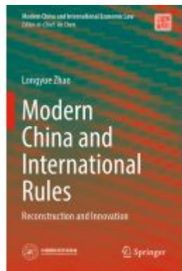
Modern China and International Rules Ladenpreis: 175,99EUR