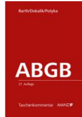
Das Allgemeine bürgerliche Gesetzbuch ABGB Ladenpreis: 134,00EUR