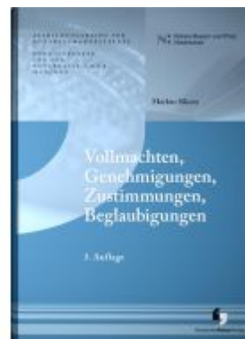
Vollmachten, Genehmigungen, Zustimmungen, Beglaubigungen Ladenpreis: 25,60EUR