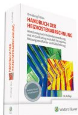
Handbuch der Heizkostenabrechnung Ladenpreis: 91,50EUR