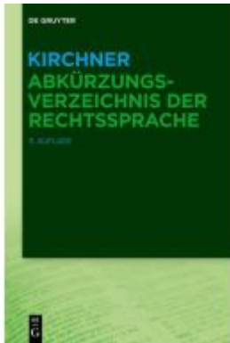
Kirchner – Abkürzungsverzeichnis der Rechtssprache Ladenpreis: 99,95EUR