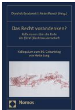
Das Recht vorandenken? Ladenpreis: 50,40EUR