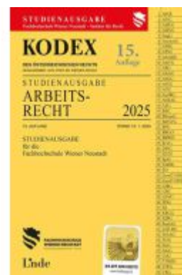
KODEX Studienausgabe Arbeitsrecht FH Wr. Neustadt 2025 Ladenpreis: 15,00EUR