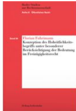
Konzeption des Hoheitlichkeitsbegriffs unter besonderer Berücksichtigung der Bedeutung im Freizügigkeitsrecht Ladenpreis: 75,00EUR