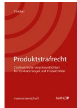
Produktstrafrecht Strafrechtliche Verantwortlichkeit für Produktmängel und Produktfehler Ladenpreis: 104,00EUR