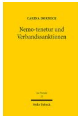
Nemo-tenetur und Verbandssanktionen Ladenpreis: 112,10EUR