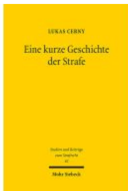
Eine kurze Geschichte der Strafe Ladenpreis: 86,40EUR