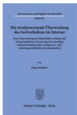
Die strafprozessuale Überwachung des Surfverhaltens im Internet. Ladenpreis: 92,50EUR