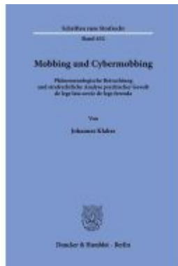
Mobbing und Cybermobbing Ladenpreis: 92,50EUR

Wir haben andere Produkte gefunden, die Ihnen gefallen könnten!