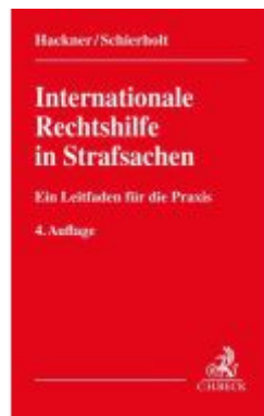
Internationale Rechtshilfe in Strafsachen Ladenpreis: 71,00EUR