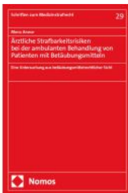
Ärztliche Strafbarkeitsrisiken bei der ambulanten Behandlung von Patienten mit Betäubungsmitteln Ladenpreis: 225,20EUR