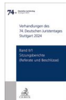
Verhandlungen des 74. Deutschen Juristentages Stuttgart 2024 Band II/1: Sitzungsberichte - Referate und Beschlüsse Ladenpreis: 173,80EUR