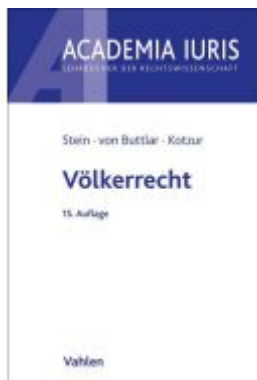
Völkerrecht Ladenpreis: 41,00EUR