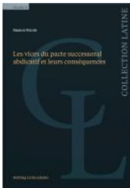
Les vices du pacte successoral abdicatif et leurs conséquences Ladenpreis: 75,00EUR

Wir haben andere Produkte gefunden, die Ihnen gefallen könnten!