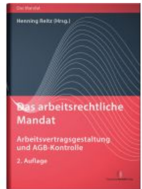
Das arbeitsrechtliche Mandat: Arbeitsvertragsgestaltung und AGB- Kontrolle Ladenpreis: 65,80EUR