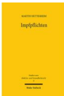
Impfpflichten Ladenpreis: 60,70EUR