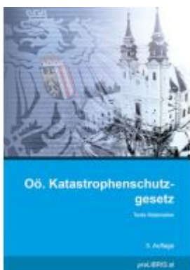
Oö. Katastrophenschutzgesetz Ladenpreis: 21,00EUR