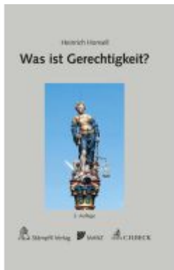
Was ist Gerechtigkeit? Ladenpreis: 29,90EUR