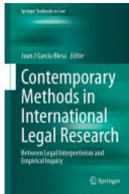
Contemporary Methods in International Legal Research Ladenpreis: 93,49EUR