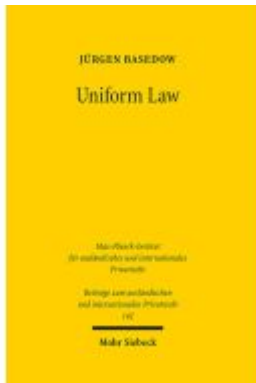
Uniform Law Ladenpreis: 132,70EUR