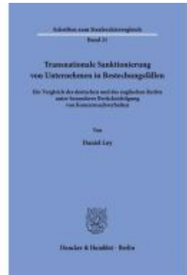
Transnationale Sanktionierung von Unternehmen in Bestechungsfällen. Ladenpreis: 154,10EUR