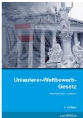
Unlauterer-Wettbewerb-Gesetz Ladenpreis: 26,00EUR

Wir haben andere Produkte gefunden, die Ihnen gefallen könnten!