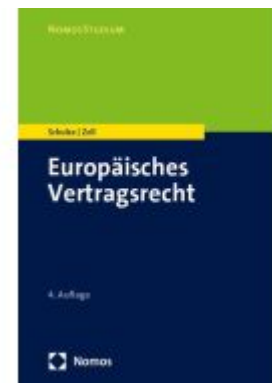
Europäisches Vertragsrecht Ladenpreis: 27,70EUR