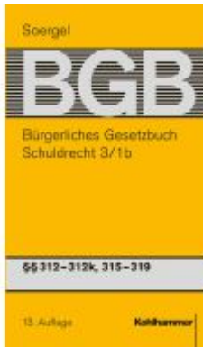
Bürgerliches Gesetzbuch mit Einführungsgesetz und Nebengesetzen (BGB) Ladenpreis: 247,00EUR