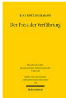
Der Preis der Verführung Ladenpreis: 81,30EUR