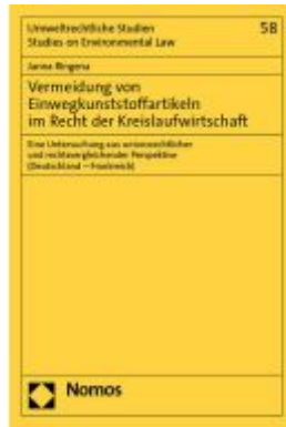
Vermeidung von Einwegkunststoffartikeln im Recht der Kreislaufwirtschaft Ladenpreis: 153,20EUR