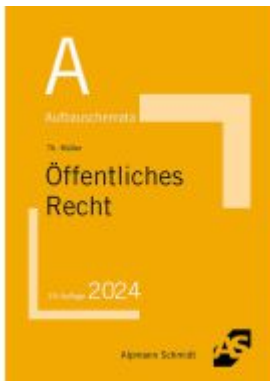
Aufbauschemata Öffentliches Recht Ladenpreis: 19,50EUR

Wir haben andere Produkte gefunden, die Ihnen gefallen könnten!