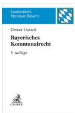
Bayerisches Kommunalrecht Ladenpreis: 34,90EUR