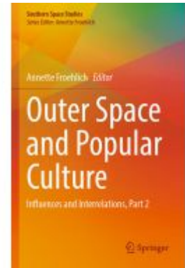
Outer Space and Popular Culture Ladenpreis: 142,99EUR