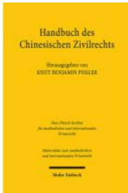
Handbuch des chinesischen Zivilrechts Ladenpreis: 180,00EUR