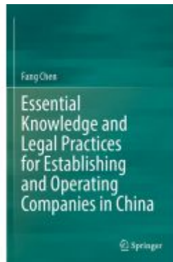
Essential Knowledge and Legal Practices for Establishing and Operating Companies in China Ladenpreis: 109,99EUR