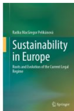
Sustainability in Europe Ladenpreis: 175,99EUR