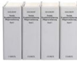
Soziale Krankenversicherung, Pflegeversicherung Ladenpreis: 122,40EUR