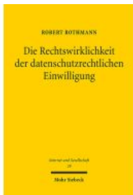
Die Rechtswirklichkeit der datenschutzrechtlichen Einwilligung Ladenpreis: 86,40EUR

Wir haben andere Produkte gefunden, die Ihnen gefallen könnten!