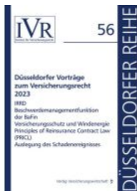
Düsseldorfer Vorträge zum Versicherungsrecht 2023 Ladenpreis: 56,40EUR