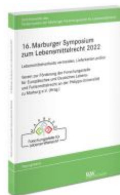
16. Marburger Symposium zum Lebensmittelrecht 2022 Ladenpreis: 71,00EUR