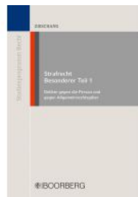
Strafrecht Besonderer Teil 1 Ladenpreis: 27,70EUR