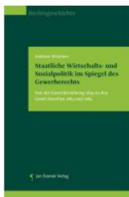
Staatliche Wirtschafts- und Sozialpolitik im Spiegel des Gewerberechts Ladenpreis: 49,90EUR