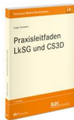
Praxisleitfaden LkSG und CS3D Ladenpreis: 91,50EUR