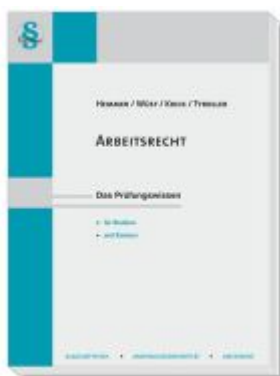
Arbeitsrecht Ladenpreis: 22,50EUR