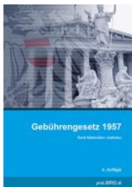
Gebührengesetz 1957 Ladenpreis: 26,00EUR