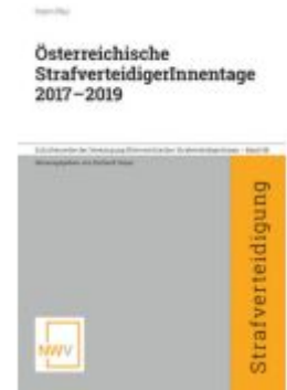
Österreichische StrafverteidigerInnenstage 2017 — 2019 Ladenpreis: 68,00EUR