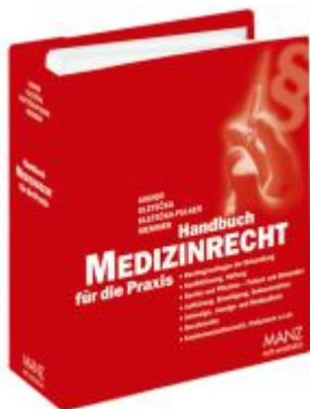
Handbuch Medizinrecht für die Praxis Ladenpreis: 198,00EUR

Wir haben andere Produkte gefunden, die Ihnen gefallen könnten!