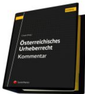
Österreichisches Urheberrecht Ladenpreis: 289,00EUR