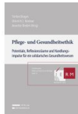
Pflege- und Gesundheitsethik Ladenpreis: 59,00EUR