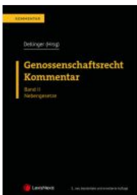
Genossenschaftsrecht - Kommentar Ladenpreis: 189,00EUR