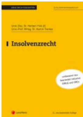
Insolvenzrecht Ladenpreis: 26,25EUR