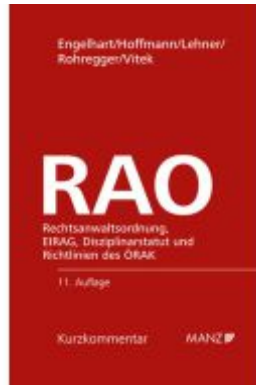
Rechtsanwaltsordnung RAO Ladenpreis: 210,00EUR