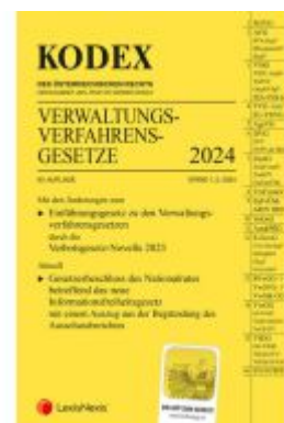
KODEX Verwaltungsverfahrens-Gesetze (AVG) 2024 - inkl. App Ladenpreis: 28,00EUR