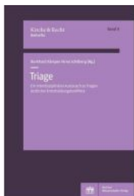
Triage Ladenpreis: 37,10EUR