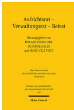
Aufsichtsrat - Verwaltungsrat - Beirat Ladenpreis: 107,00EUR