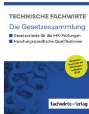
Technische Fachwirte - Gesetzessammlung Ladenpreis: 28,80EUR