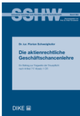
Die aktienrechtliche Geschäftschancenlehre Ladenpreis: 134,00EUR