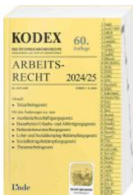
KODEX Arbeitsrecht 2024/25 Ladenpreis: 37,00EUR