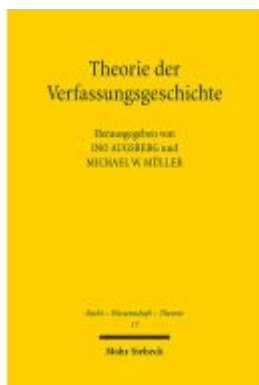
Theorie der Verfassungsgeschichte Ladenpreis: 76,10EUR