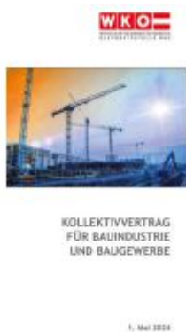
Kollektivvertrag für Bauindustrie und Baugewerbe (Arbeiter) Ladenpreis: 6,90EUR