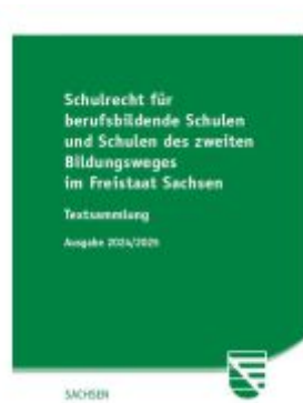
Schulrecht für berufsbildende Schulen und Schulen des zweiten Bildungsweges im Freistaat Sachsen Ladenpreis: 21,50EUR