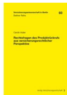
Rechtsfragen des Produktrückrufs aus versicherungsrechtlicher Perspektive Ladenpreis: 61,50EUR