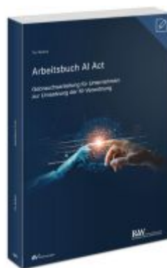
Arbeitsbuch AI Act Ladenpreis: 50,40EUR