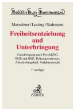
Freiheitsentziehung und Unterbringung Ladenpreis: 163,50EUR