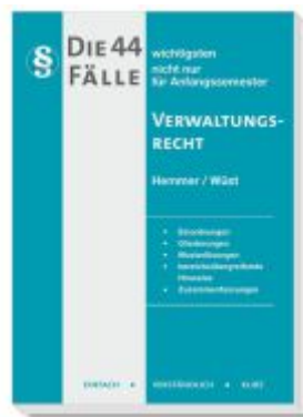
Die 44 wichtigsten Fälle Verwaltungsrecht Ladenpreis: 15,30EUR