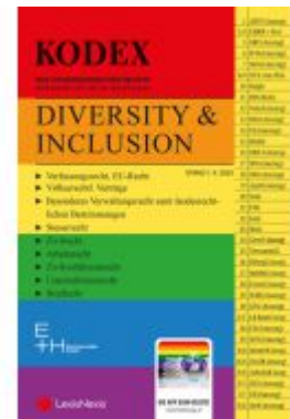
KODEX Diversity & Inclusion Ladenpreis: 40,00EUR