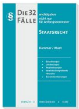
Die 32 wichtigsten Fälle Staatsrecht Ladenpreis: 15,30EUR