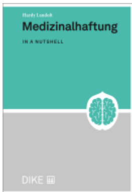
Medizinalhaftung Ladenpreis: 44,00EUR