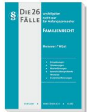
Die 26 wichtigsten Fälle Familienrecht Ladenpreis: 15,30EUR