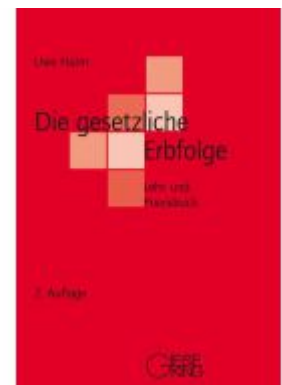
Die gesetzliche Erbfolge Ladenpreis: 35,80EUR