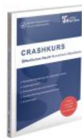
CRASHKURS Öffentliches Recht - NRW Ladenpreis: 28,70EUR