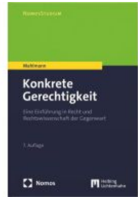
Konkrete Gerechtigkeit Ladenpreis: 30,00EUR