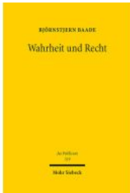
Wahrheit und Recht Ladenpreis: 148,10EUR