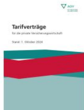
Tarifverträge für die private Versicherungswirtschaft Ladenpreis: 25,50EUR