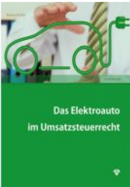
Das Elektroauto im Umsatzsteuerrecht Ladenpreis: 24,00EUR