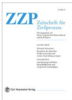
Zeitschrift für Zivilprozess International. ZfP Int. Jahrbuch des... / Zeitschrift für Zivilprozess International. Ladenpreis: 150,10EUR