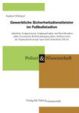
Gewerbliche Sicherheitsdienstleister im Fußballstadion Ladenpreis: 27,70EUR