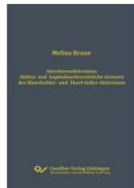
Investorenaktivismus Ladenpreis: 97,70EUR