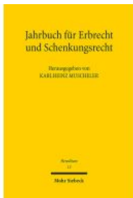
Jahrbuch für Erbrecht und Schenkungsrecht Ladenpreis: 60,70EUR