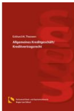
Allgemeines Wertpapier- und Einlagengeschäft Ladenpreis: 46,30EUR