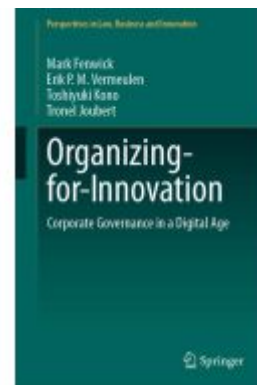
Organizing-for-Innovation Ladenpreis: 142,99EUR