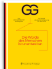
Das Grundgesetz als Magazin - 75 Jahre Ladenpreis: 10,00EUR