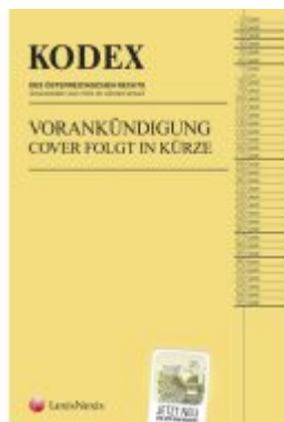
KODEX Strafrecht für die WU 2024/25 - inkl. App Ladenpreis: 22,00EUR

Wir haben andere Produkte gefunden, die Ihnen gefallen könnten!