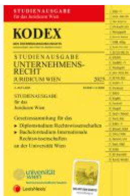
KODEX Unternehmensrecht Wien Juridicum 2025 - inkl. App Ladenpreis: 28,00EUR