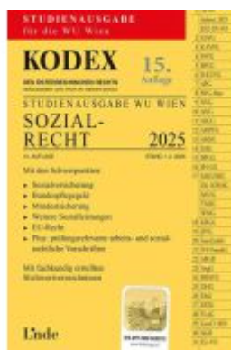
KODEX Studienausgabe Sozialrecht WU 2025 Ladenpreis: 15,00EUR