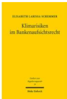
Klimarisiken im Bankenaufsichtsrecht Ladenpreis: 112,10EUR