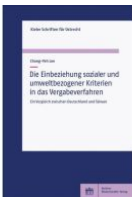
Die Einbeziehung sozialer und umweltbezogener Kriterien in das Vergabeverfahren Ladenpreis: 46,30EUR