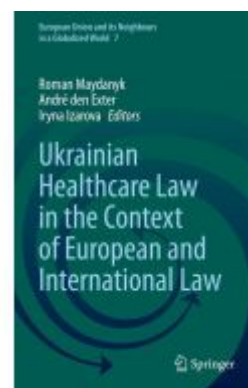
Ukrainian Healthcare Law in the Context of European and International Law Ladenpreis: 109,99EUR