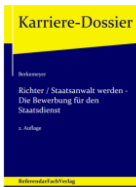
Richter / Staatsanwalt werden – Die Bewerbung für den Staatsdienst Ladenpreis: 20,60EUR