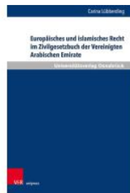
Europäisches und islamisches Recht im Zivilgesetzbuch der Vereinigten Arabischen Emirate Ladenpreis: 42,00EUR