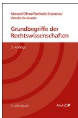
Grundbegriffe der Rechtswissenschaften Ladenpreis: 40,70EUR