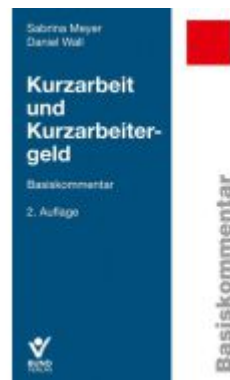
Kurzarbeit und Kurzarbeitergeld Ladenpreis: 50,40EUR